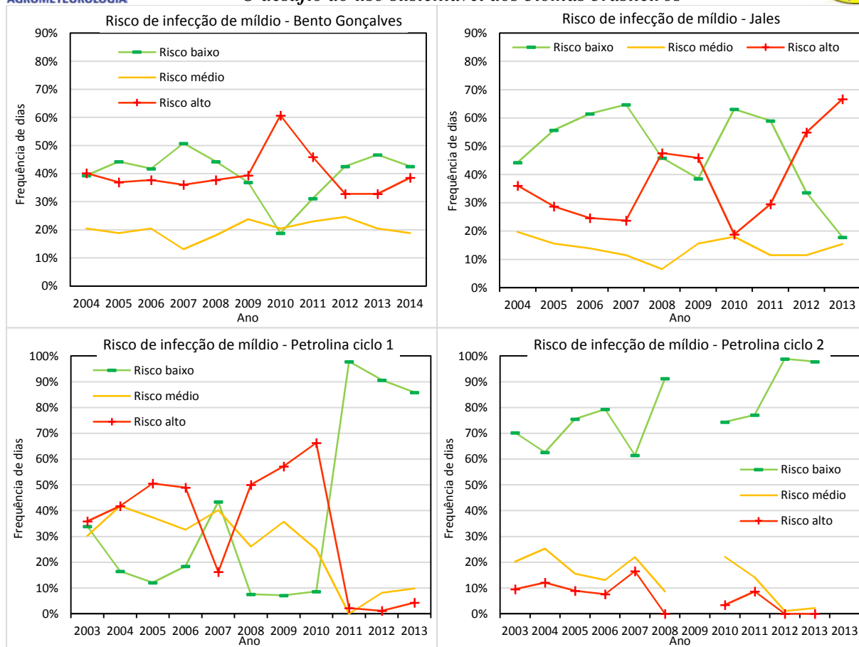
Figura 2. Frequência de ocorrência de dias com risco baixo, médio e alto de infecção de míldio ( Plasmoparaviticola ), em Bento Gonçalves, RS, Jales, SP e Petrolina, PE, calculada durante o período de 2003 a 2014 nos meses iniciais do ciclo da cultura nessas regiões.

A Tabela 1 apresenta o desvio padrão das frequências de dias com risco baixo, médio e alto para míldio nas regiões estudadas. O desvio padrão serve como um indicador da variabilidade que ocorre nessas regiões em termos de condições de favorabilidade para adoção estudada. Neste caso, o indicador mostra se a favorabilidade permanece mais ou menos constante ou se muda muito de um ano para outro.